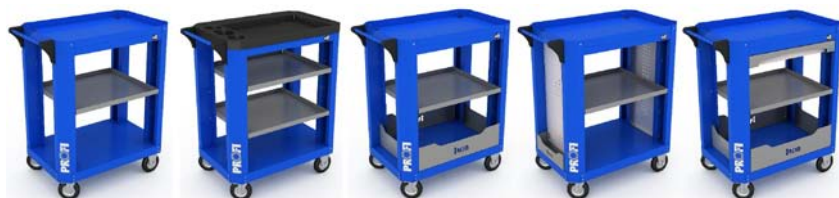
Тележка PROFИ №1 Артикул 300-0001-01 Тележка PROFИ №2 Артикул 300-0002-00 Тележка PROFИ №3 Артикул 300-0003-00 Тележка PROFИ №4 Артикул 300-0004-00 Тележка PROFИ №5 Артикул 300-0005-00