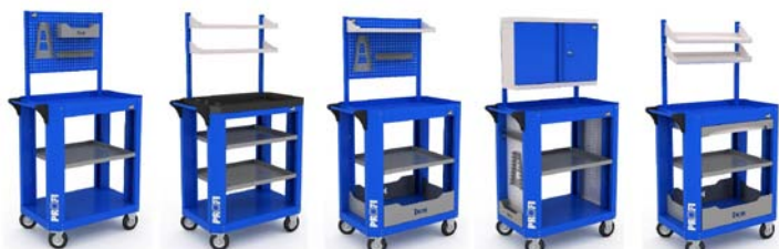
Тележка PROFИ №1-1 Артикул 301-1001-00 Тележка PROFИ №2-2 Артикул 301-1001-00 Тележка PROFИ №3-3 Артикул 301-1001-00 Тележка PROFИ №4-4 Артикул 301-1001-00 Тележка PROFИ №5-5 Артикул 301-1001-00